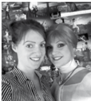
so sestrou Lillou