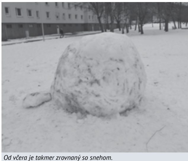
Od včera je takmer zrovnaný so snehom.