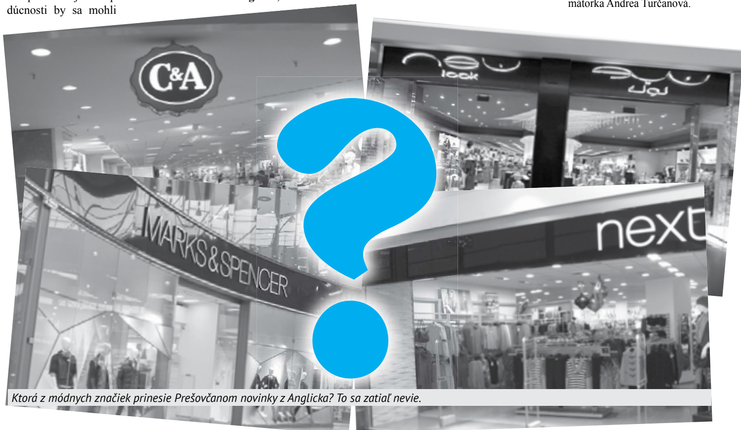
Ktorá z módných značiek prinesie Prešovčanom novinky z Anglicka? To sa zatiaľ nevie.