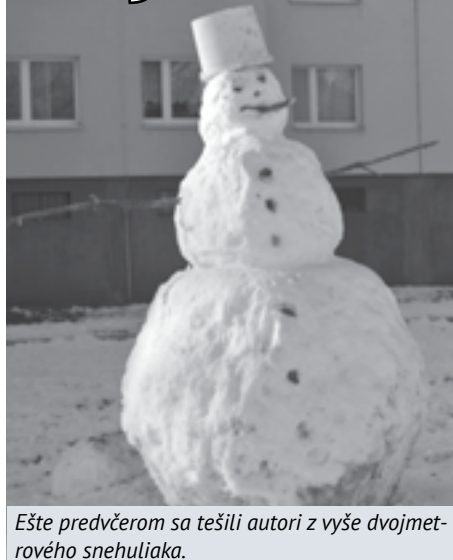
Ešte predvčera sa tešili autori z vyše dvojmetrového snehuliaka.