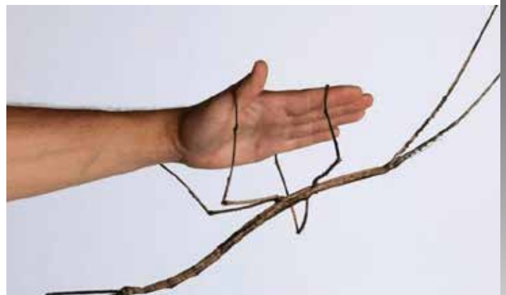
Phryganistria je najdlhší chrobák na svete a môže dorásť do dĺžky väčšej než 60 cm.

už 83 % voľne žijúcich cicavcov a polovicu všetkého rastlinného života.