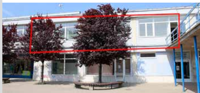
Nám. Kráľovnej pokoja 3